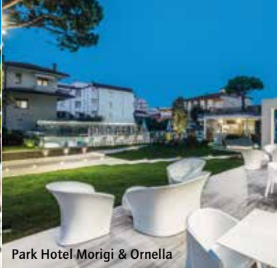
Park Hotel Morigi & Ornella